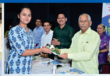
सभासदांच्या गुणवंत पाल्यांचा सत्कार करते प्रसंगी