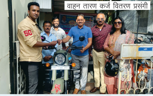
वाहन तारण कर्ज वितरण प्रसंगी