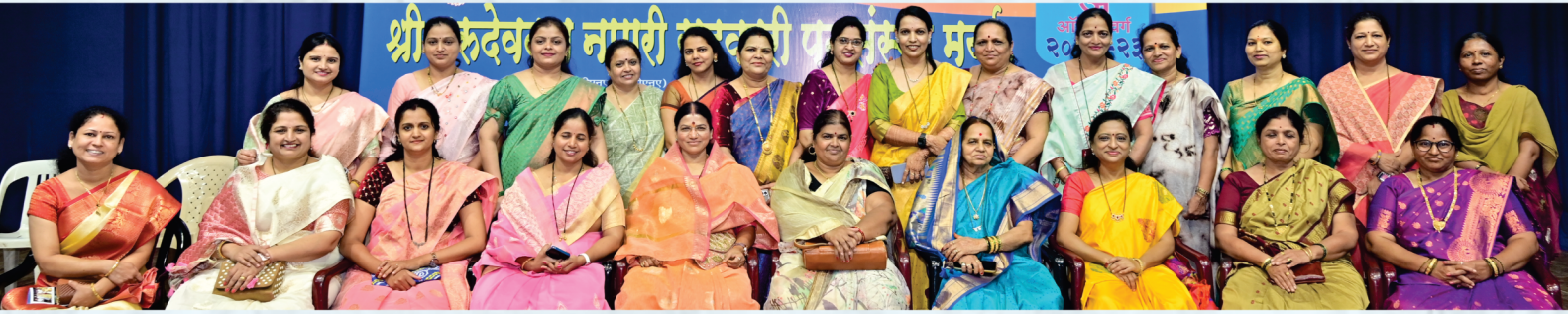
वार्षिक सर्वसाधारण सभेस उपस्थित मान्यवर महिला सभासद व कर्मचारी