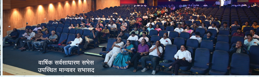
वार्षिक सर्वसाधारण सभेस उपस्थित मान्यवर सभासद